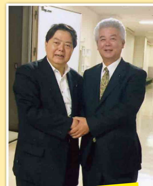
林 芳正 元文部科学大臣長崎来訪時懇談