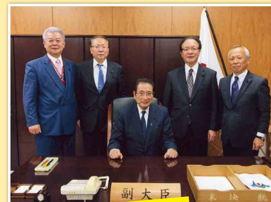
加藤寛治農林水産副大臣へ自民党県民会議で要望