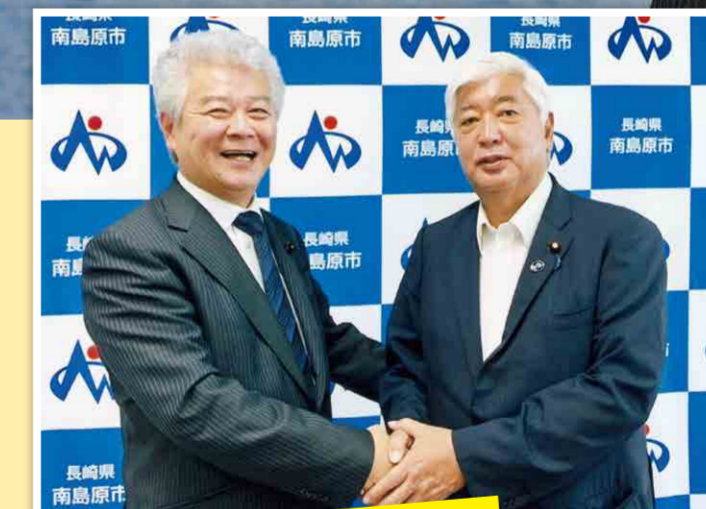
中谷 元 元防衛大臣南島原市来訪時懇談