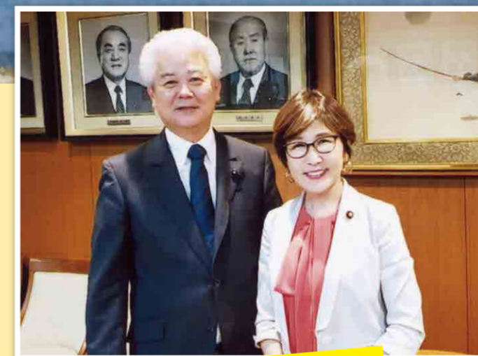
稲田朋美自民党幹事長代行へ予算獲得の要望